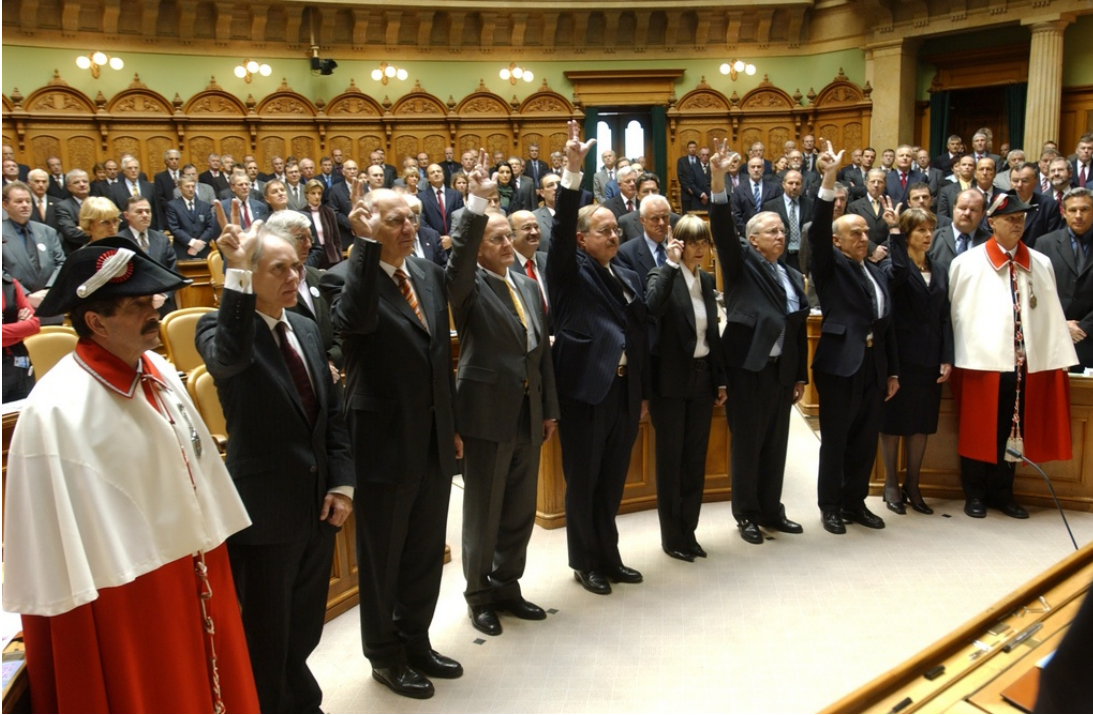
10. Dezember 2003 in der Vereinigten Bundesversammlung: Der Bundesrat wird vereidigt.

von Moritz Leuenberger am 10. Dezember 2007 [Version française Bonheur et stabilité politique ]